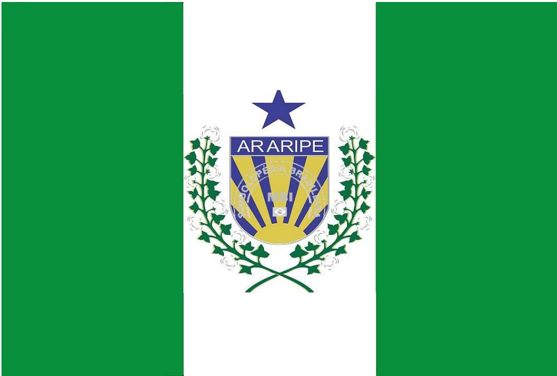
Bandeira oficial do Município