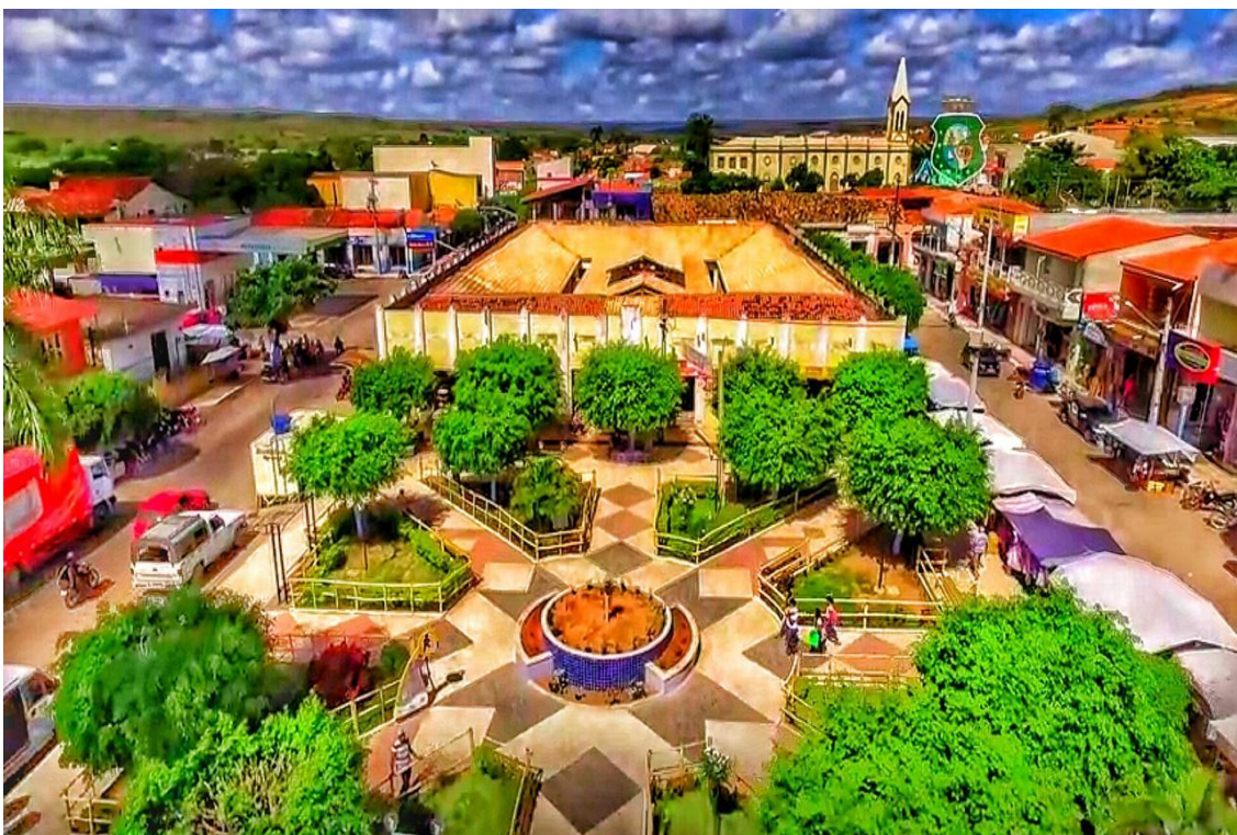
Imagem panorâmica da Praça Raimundo Elesbão de Oliveira